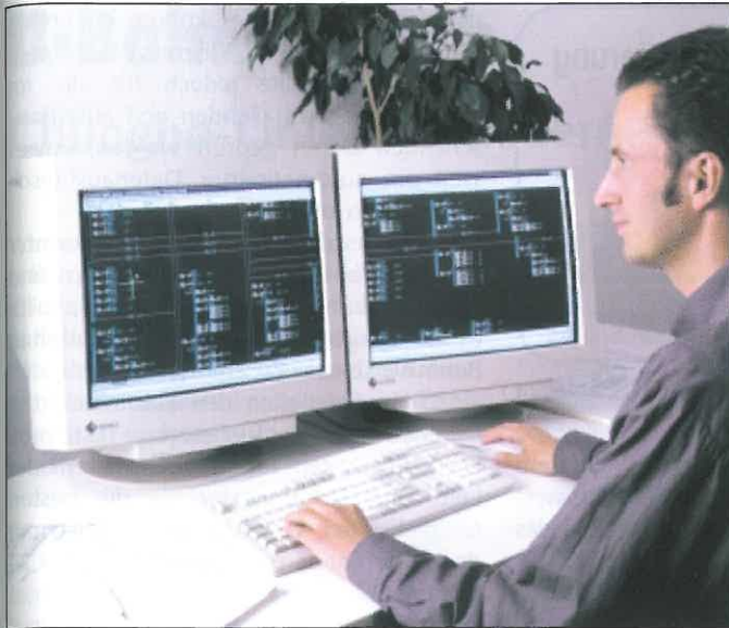
Abb. 1: Planung mit ProSig